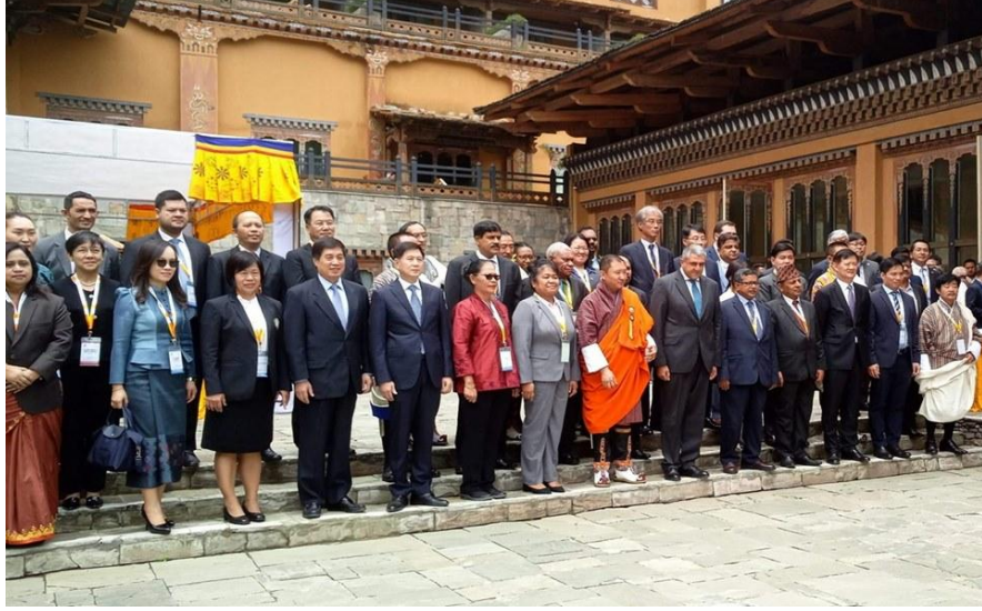
57th Meeting of the UNWTO Commission for South Asia (CSA)

এ সকল অংশগ্রহণের ফলে আন্তর্জাতিক অঙ্গনে বাংলাদেশকে উপস্থাপনের সুযোগ সৃষ্টি হয়। কনফারেন্সের মাধ্যমে লব্ধ জ্ঞান এবং পর্যটন উন্নয়নে আন্তর্জাতিক উদ্ভাবন ও ধারণা প্রয়োগপূর্বক বাংলাদেশের পর্যটন উন্নয়নে গুরুত্বপূর্ণ অবদান রাখা সম্ভব হবে।