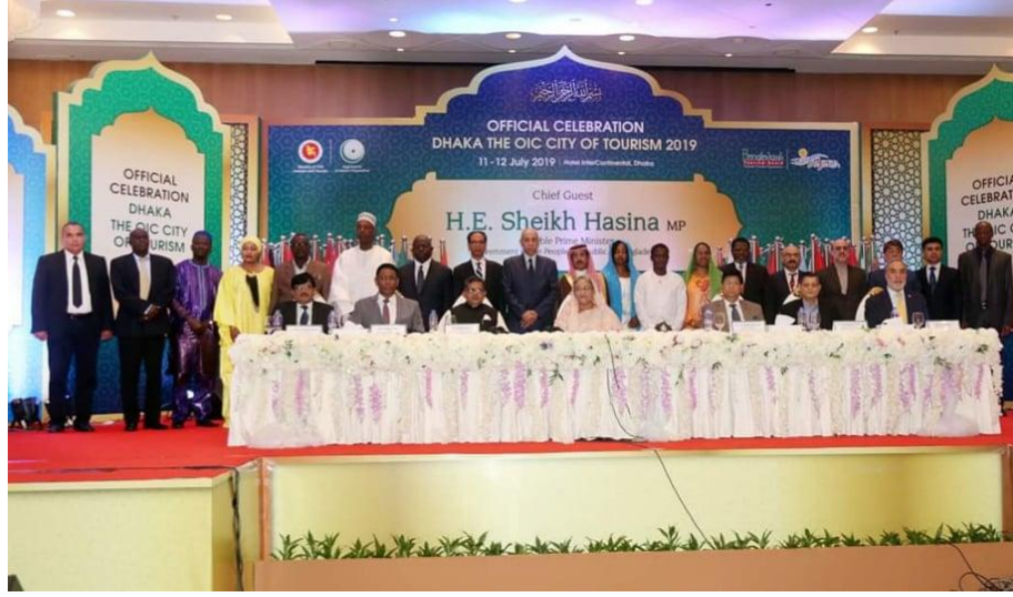
Picture: Official Celebration Dhaka the OIC City of Tourism 2019