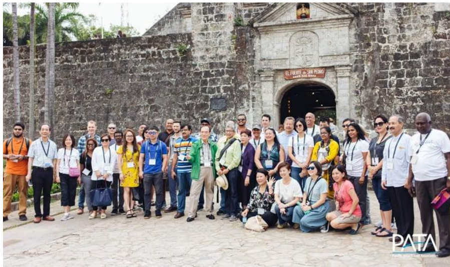
Picture: PATA Annual Summit-2019