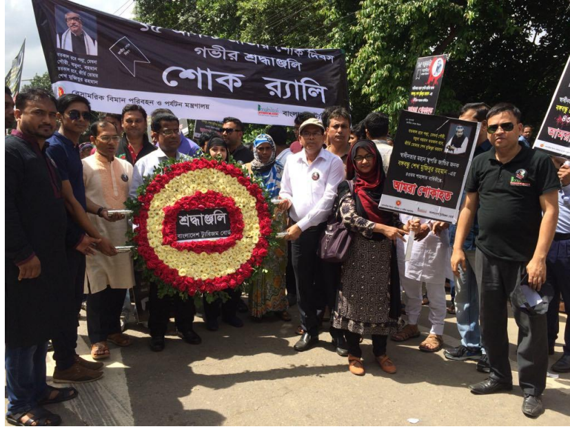
ছবি: জাতীয় শোক দিবস ২০১৮ উপলক্ষ্যে জাতির পিতার স্মৃতিস্তম্ভে শ্রদ্ধাঞ্জলি নিবেদন

১৫ আগস্ট ২০১৮ জাতির পিতা বঙ্গবন্ধু শেখ মুজিবুর রহমানের ৪৩ তম শাহাদত বার্ষিকীতে জাতীয় শোক দিবস পালন উপলক্ষে বেসামরিক বিমান পরিবহন ও পর্যটন মন্ত্রণালয়ের নেতৃত্বে বাংলাদেশ ট্যুরিজম বোর্ড-এর কর্মকর্তা/কর্মচারীগণ শোক র্যালীসহ জাতির জনক বঙ্গবন্ধু শেখ মুজিবুর রহমান-এর স্মৃতিস্তম্ভে শ্রদ্ধাঞ্জলি অর্পণ করে এবং ১৬ আগস্ট বিটিবির সম্মেলন কক্ষে বিশেষ আলোচনা ও দোয়া মাহফিলের আয়োজন করা হয়।