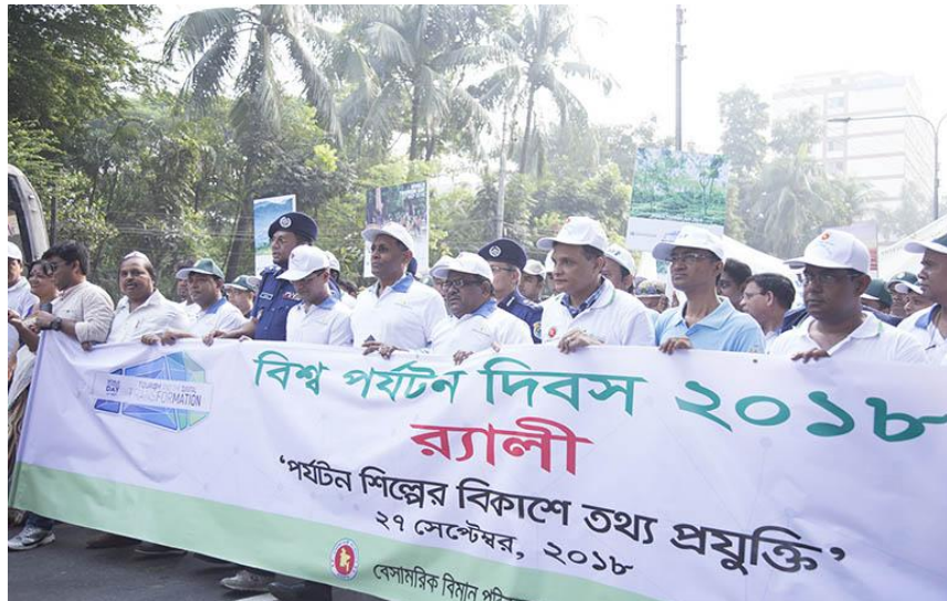
ছবি: বিশ্ব পর্যটন দিবস ২০১৮ উদযাপন

২৭ সেপ্টেম্বর ২০১৮ বিশ্ব পর্যটন দিবসের গৃহিত সকল কর্মসূচি আড়ম্বরপূর্ণ পরিবেশে উদযাপন করা হয়। ব্যানার, ফেস্টুন, প্লেকার্ড, পর্যটন শিল্পের প্রদর্শন ও প্রচারণার জন্য ঘোড়ার গাড়ী, সুসজ্জিত পিক-আপ-এ বাউল সঙ্গীত পরিবেশন ইত্যাদিসহ বর্ণাঢ্য র্যালী আয়োজন; শহরের গুরুত্বপূর্ণ সড়কদ্বীপ, ফুট ওভারব্রিজসহ নির্ধারিত সড়ক ব্র্যাডিং; বিশেষ ক্রোড়পত্র প্রকাশ; আলোচনা সভা, টক-শো, ফুড ফ্যাস্টিভাল, সাংস্কৃতিক অনুষ্ঠান ইত্যাদি আয়োজন ও বাস্তবায়ন করা হয়।